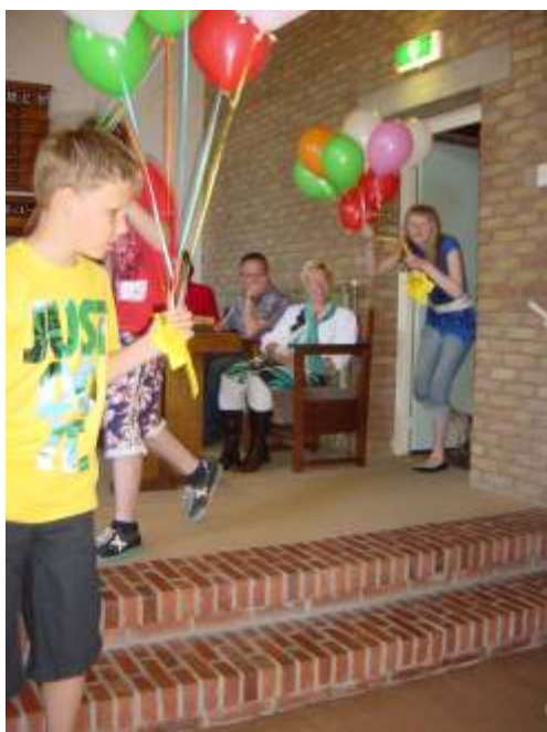
De kinderen komen met de ballonnen in de kerk