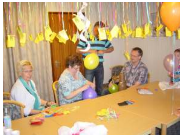
Het klaarmaken van de ballonnen