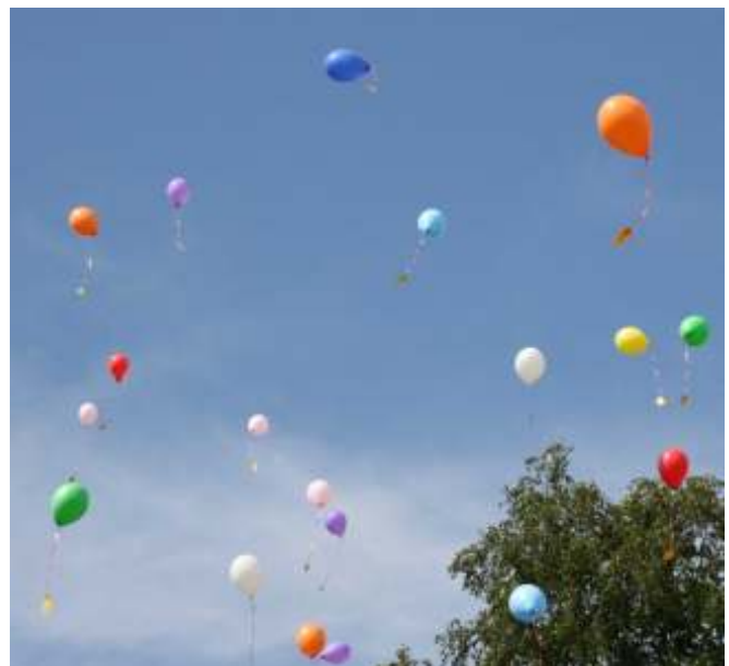
Daar gaan ze dan. Helaas gaan er ook een aantal in de bomen