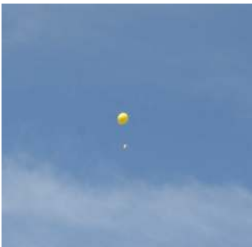
Een (te) vroeg losgelaten eenling die alvast verteld dat de rest er aankomt