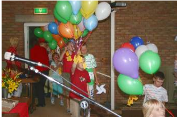
De kinderen komen met de ballonnen in de kerk

Verleden jaar is er één kaartje teruggekomen. We zijn benieuwd of dat dit jaar ook weer zal gebeuren.